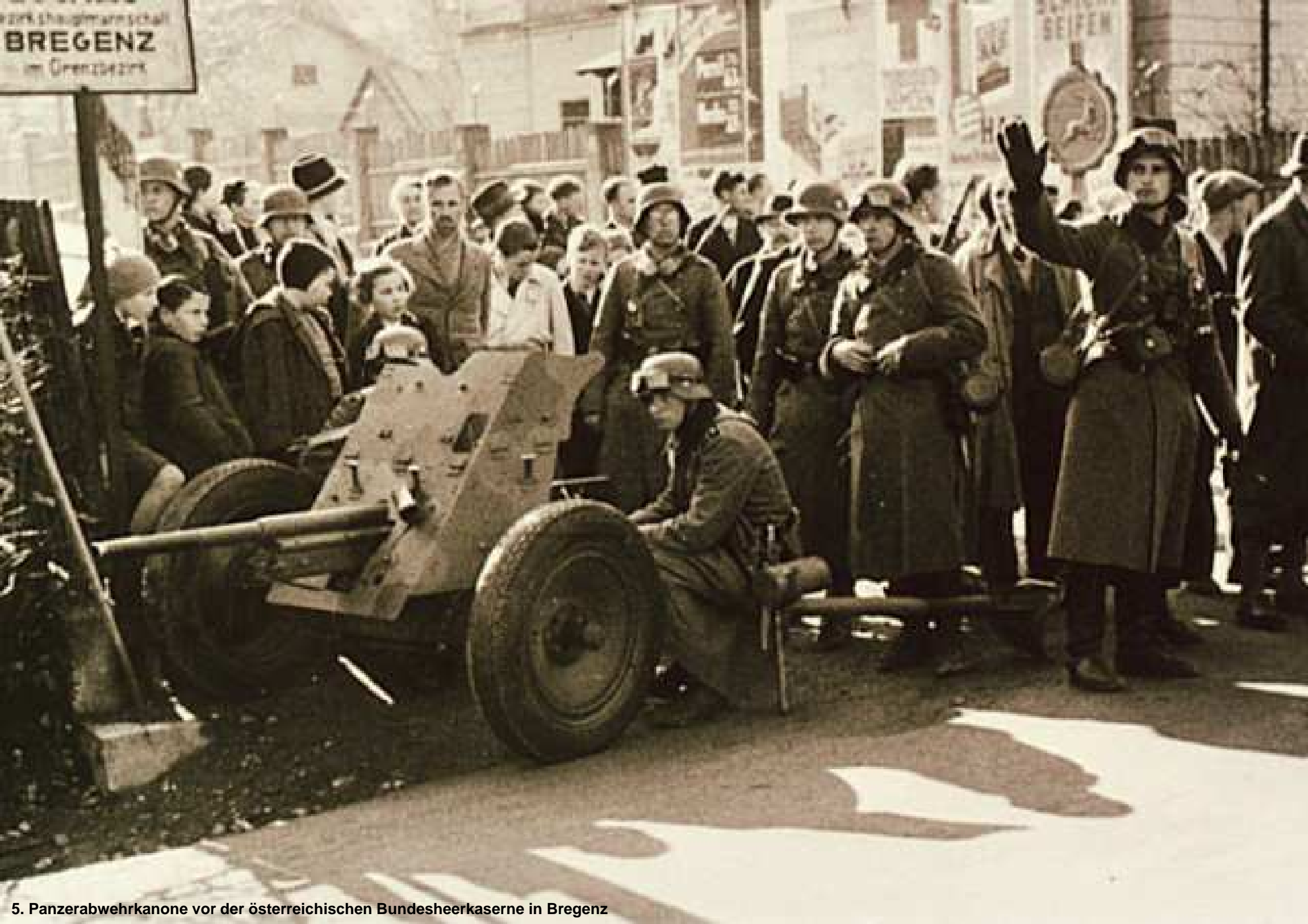
5. Panzerabwehrkanone vor der österreichischen Bundesheerkaserne in Bregenz