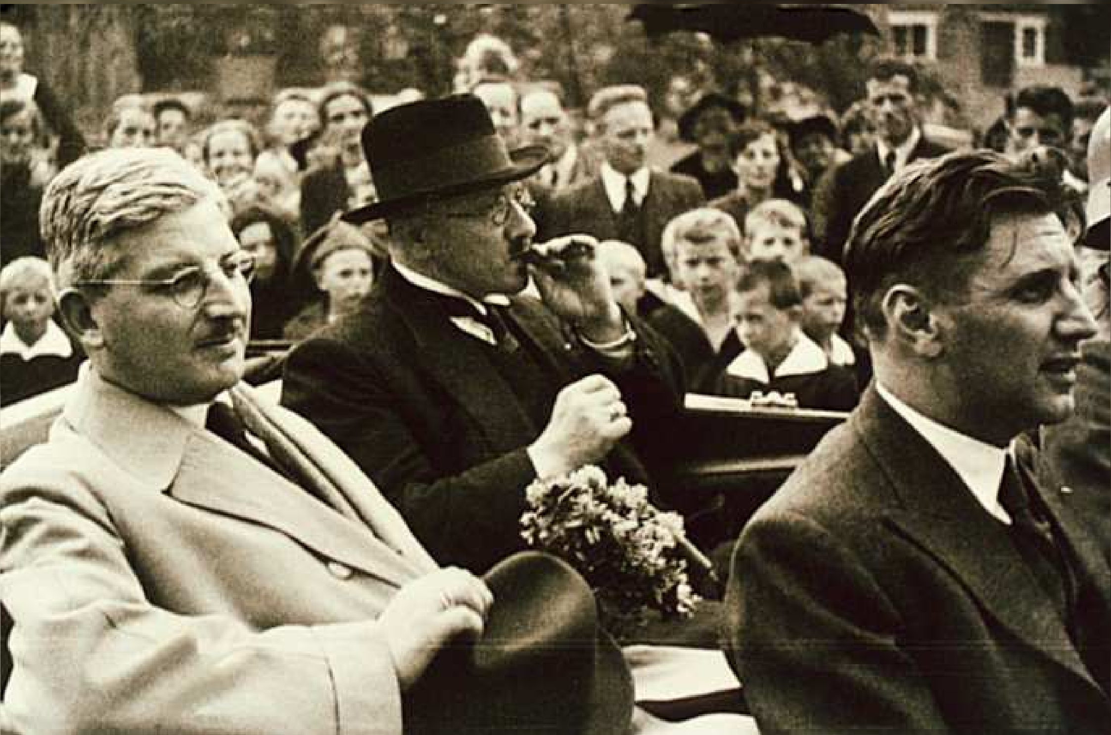
2. Kanzler Schuschnigg, Landeshauptmann Winsauer und Eduard Ulmer