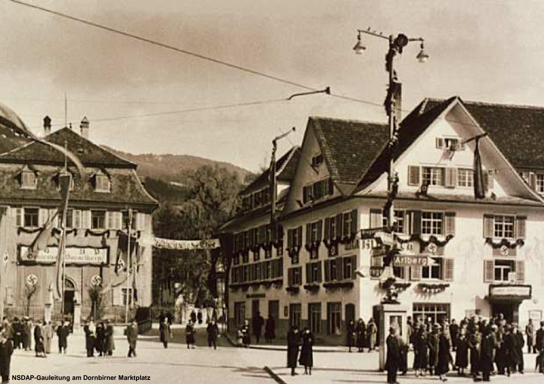
3. NSDAP-Gauleitung am Dornbirner Marktplatz