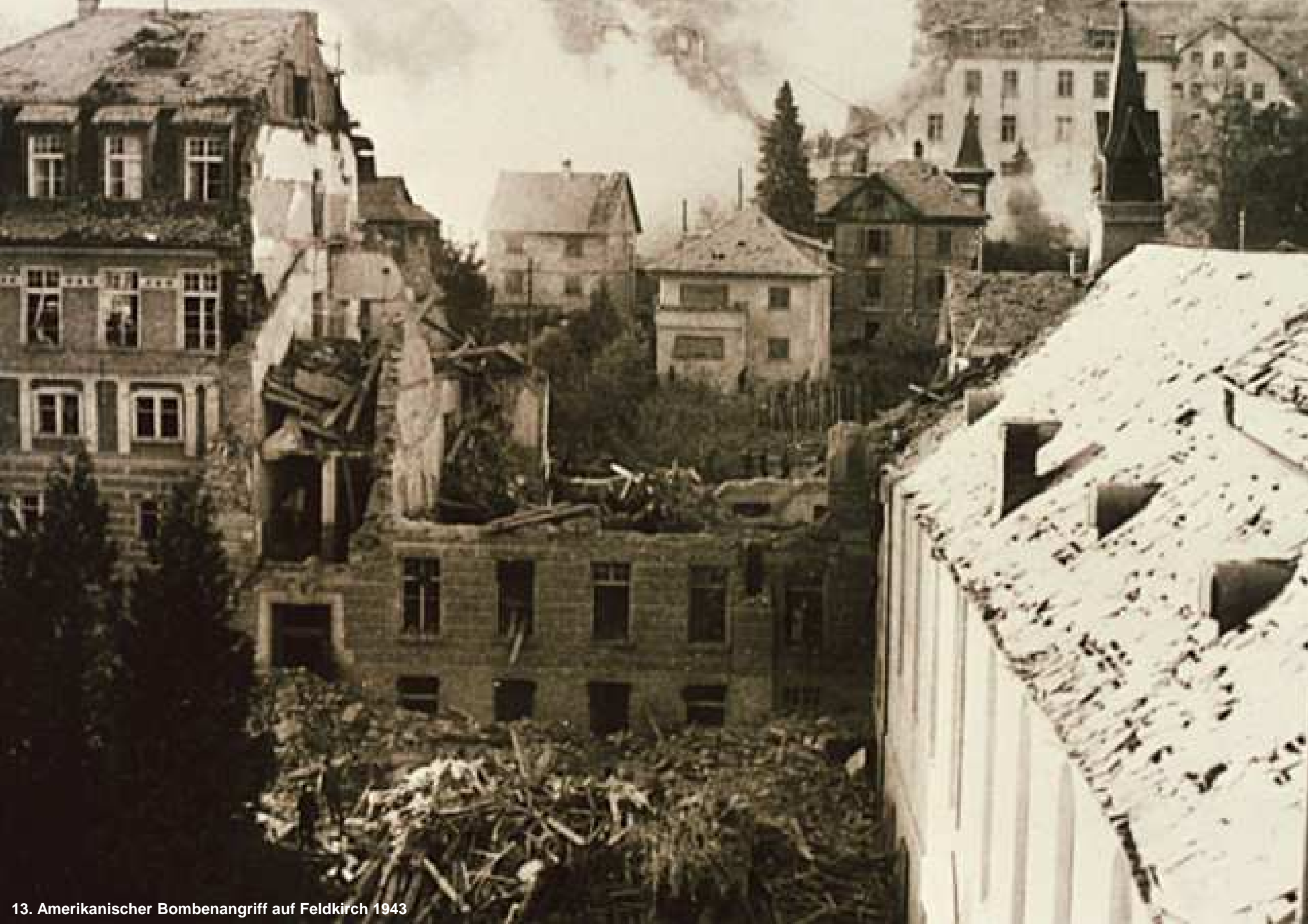
13. Amerikanischer Bombenangriff auf Feldkirch 1943