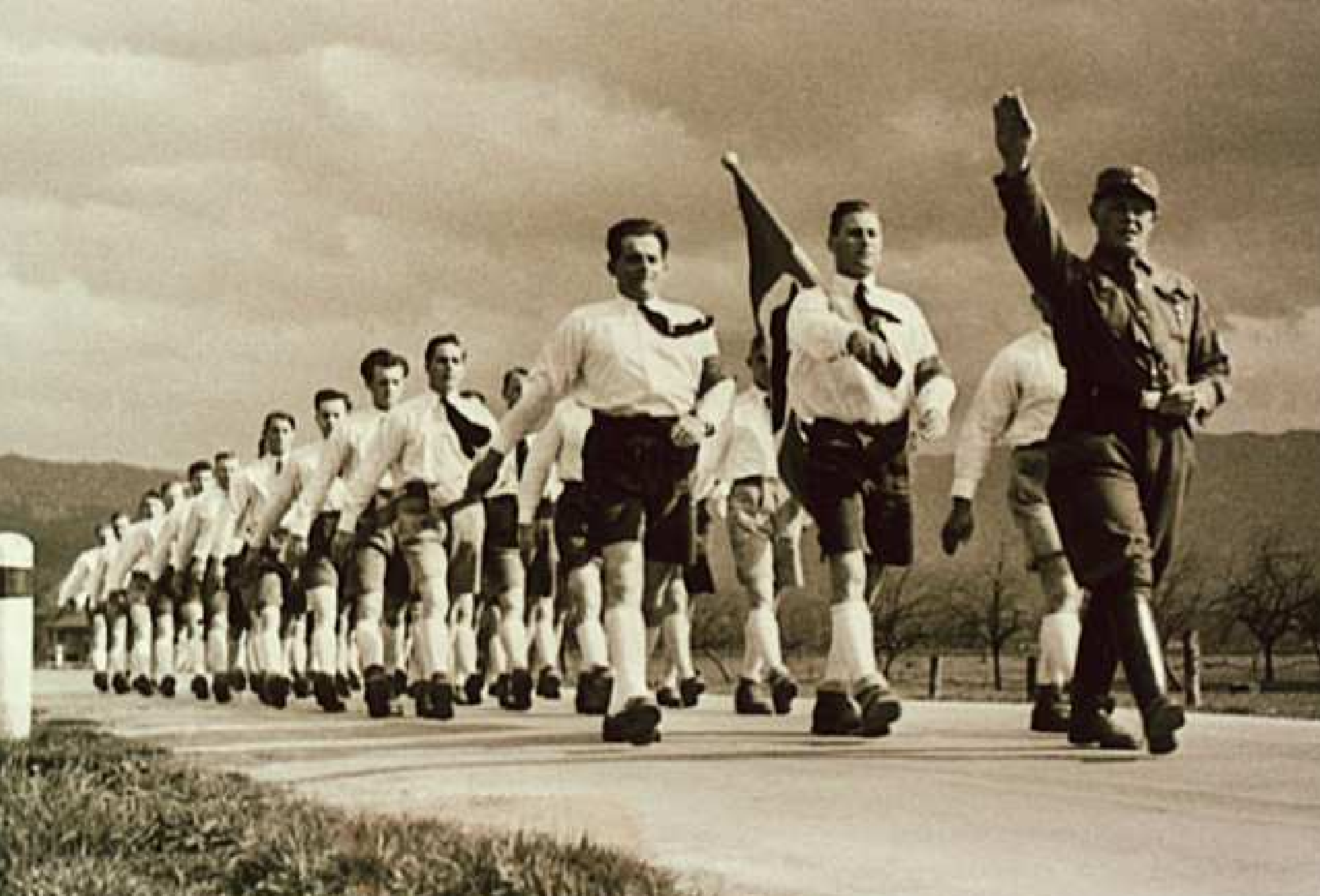
4. Lustenauer SA-Trupp auf dem Weg nach Bregenz