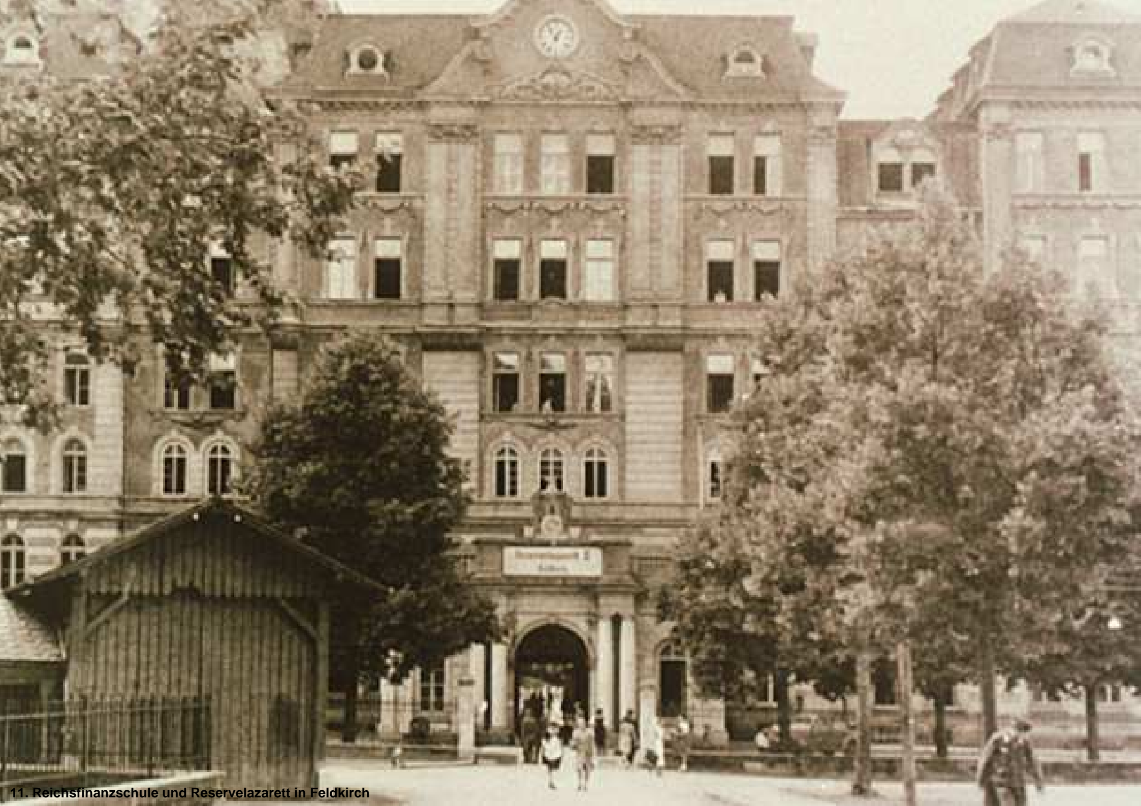
11. Reichsfinanzschule und Reservelazarett in Feldkirch