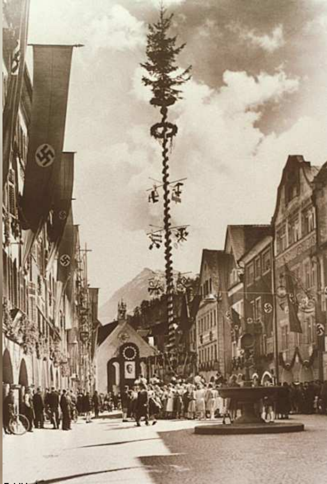
9. „Ehrenbogen“ zu Hitlers 50. Geburtstag in Feldkirch