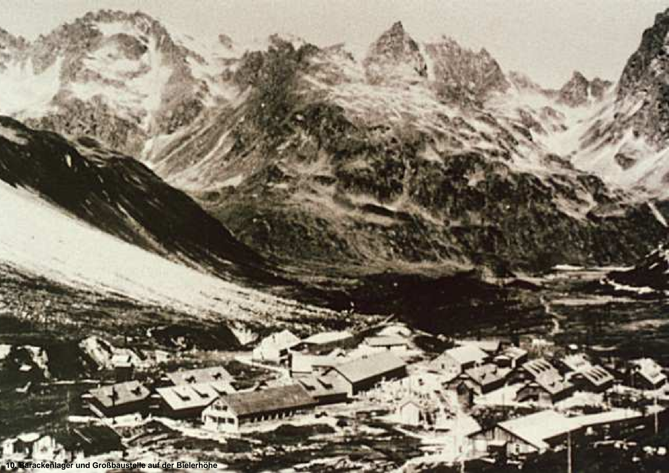
10. Barackenlager und Großbaustelle auf der Bielerhöhe