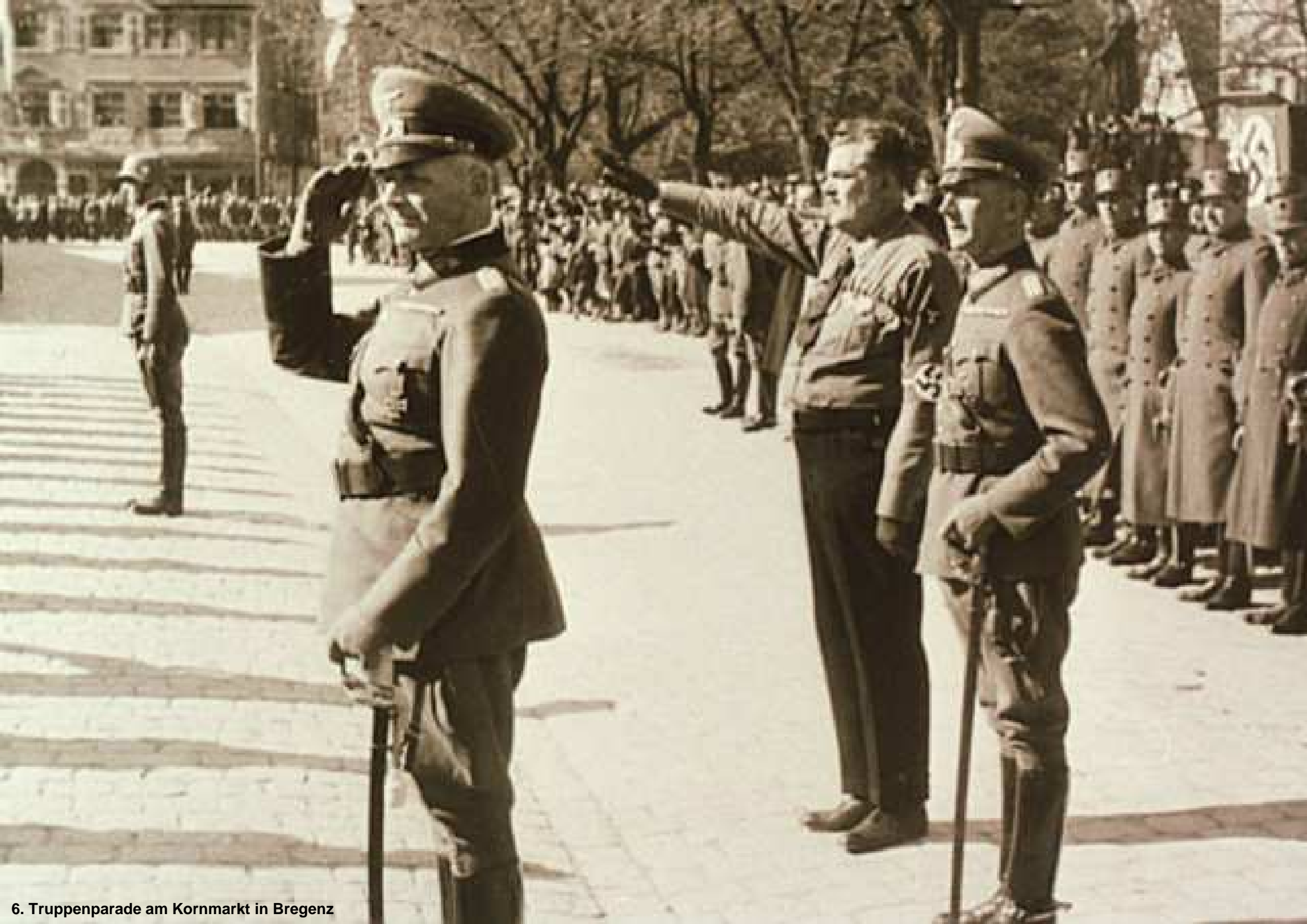
6. Truppenparade am Kornmarkt in Bregenz